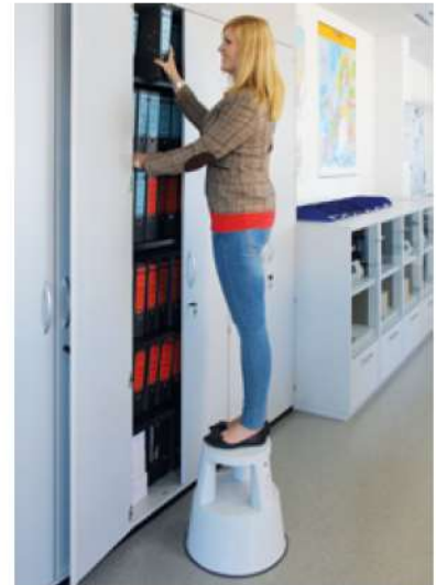
Abb. Bestell-Nr. 50001