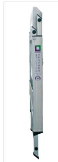
Abb. Bestell-Nr. 55003