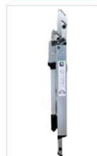
Abb. Bestell-Nr. 53103