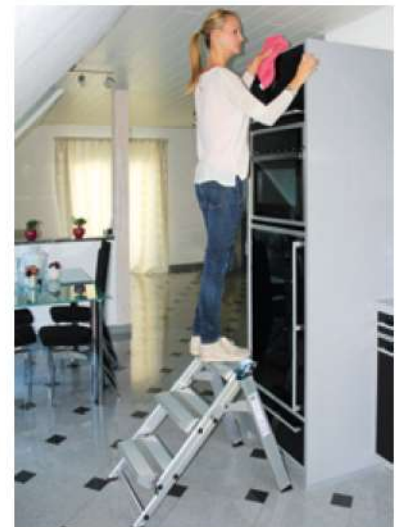
Abb. Bestell-Nr. 55003