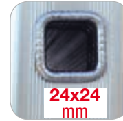
24x24 mm Quadratische Sprossen