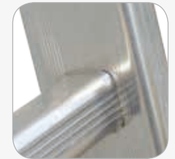
Zweifach geweitete und gebördelte Sprossen-Holm- Verbindung.

ACHTUNG!! SEHR GUTES PREIS-LEISTUNGS- VERHÄLTNIS