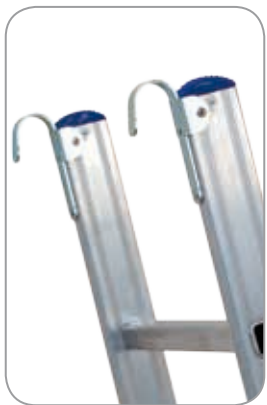
ZUBEHÖR: Einhängehaken-Set aus Stahl.