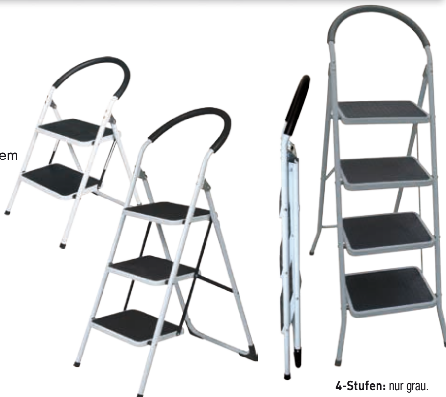
4-Stufen: nur grau.

STRUKTUR: Grau STUFEN: Grau KUNSTSTOFFTEILE: Schwarz