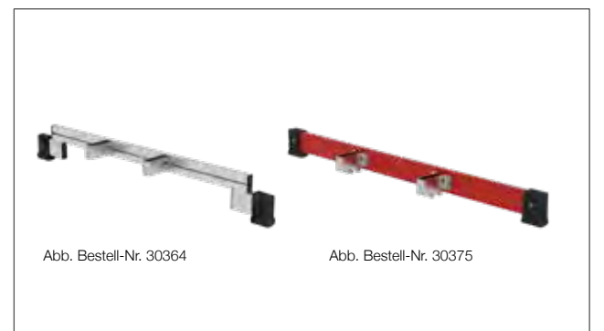
Abb. Bestell-Nr. 30364