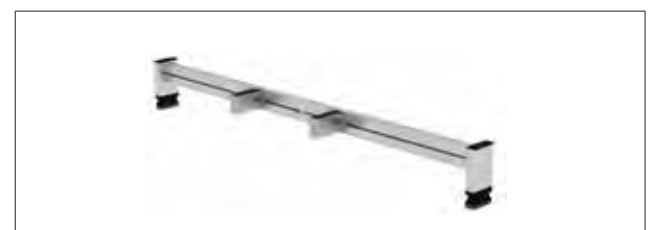
Abb. Bestell-Nr. 30368