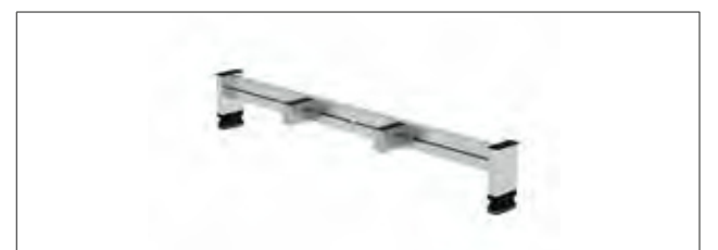
Abb. Bestell-Nr. 30366