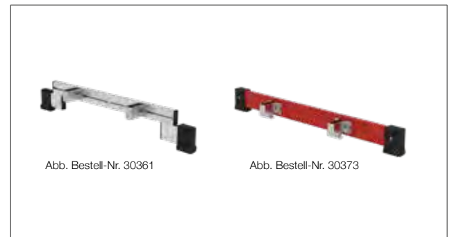
Abb. Bestell-Nr. 30361