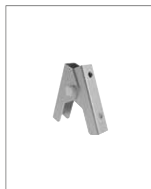
Abb. Bestell-Nr. 19420