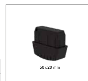
50 x 20 mm