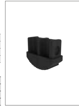
Abb. Bestell-Nr. 19190