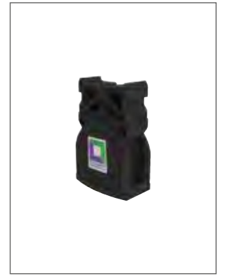
Abb. Bestell-Nr. 19201