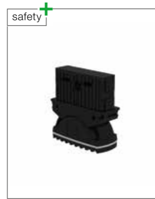
Abb. Bestell-Nr. 19206