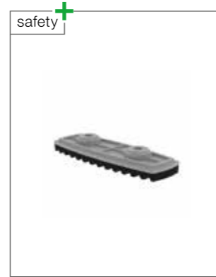
Abb. Bestell-Nr. 19210

Leicht wechselbare Fußplatten in unterschiedlichen Varianten