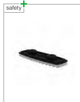
Abb. Bestell-Nr. 19212