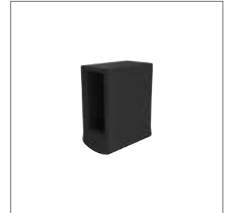
Abb. Bestell-Nr. 19198