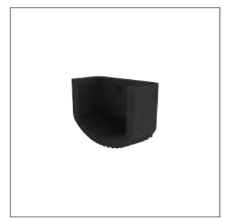
Abb. Bestell-Nr. 19252