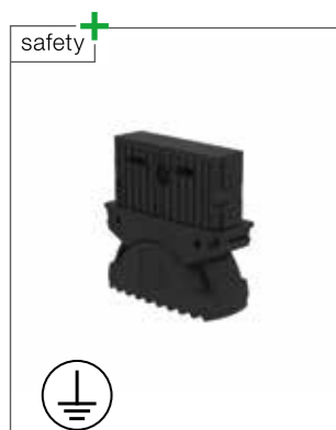
Abb. Bestell-Nr. 19216