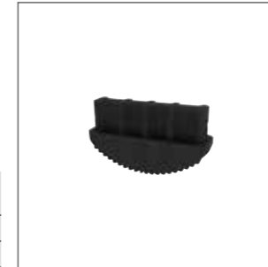
Abb. Bestell-Nr. 32032