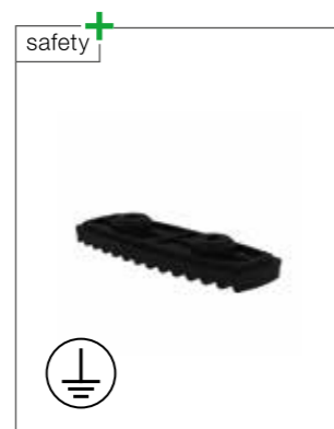
Abb. Bestell-Nr. 19220, Verwendung nur in Verbindung mit nivello®-Innenschuh Bestell-Nr. 19215 – 19218