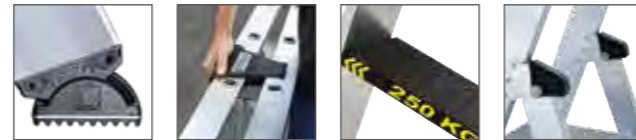
Abb. Bestell-Nr. 42704