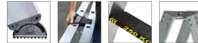
Abb. Bestell-Nr. 43805