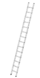
Abb. Bestell-Nr. 10014