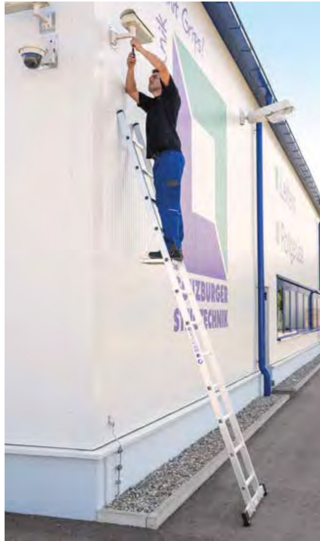
Abb. Bestell-Nr. 10112 und Bestell-Nr. 19910