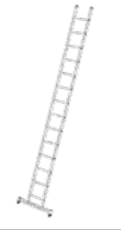
Abb. Bestell-Nr. 10314