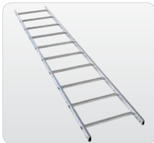
Leiternteil 2,80 m 10 Sprossen