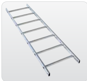
Leiternteil 1,96 m 7 Sprossen