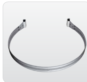
Rückenschutz- bügel Ø 700 mm