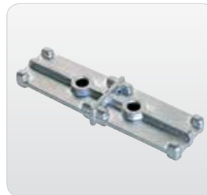
Steigleiterverbinder 200 mm