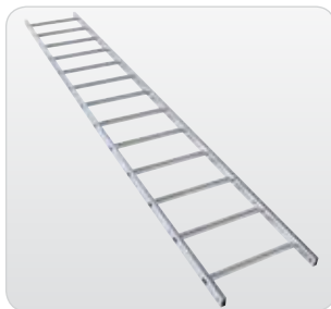
Leiternteil 3,64 m 13 Sprossen